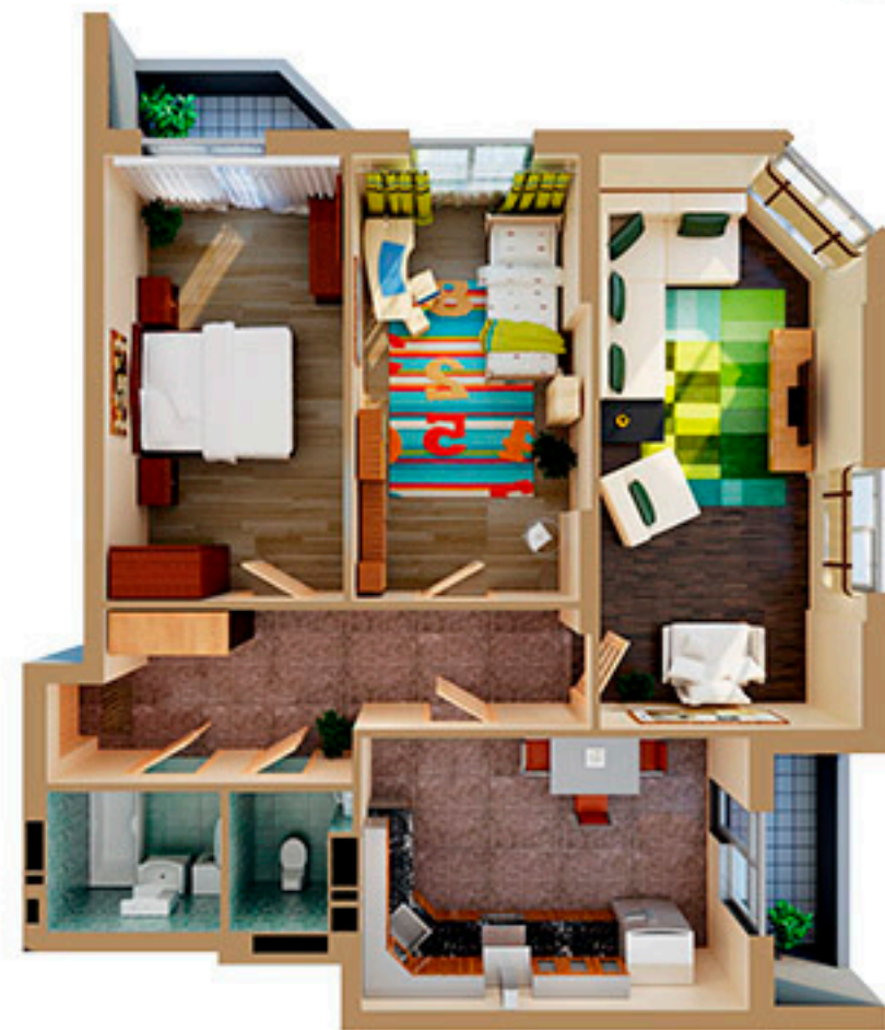
Схема розташування квартири на поверсі